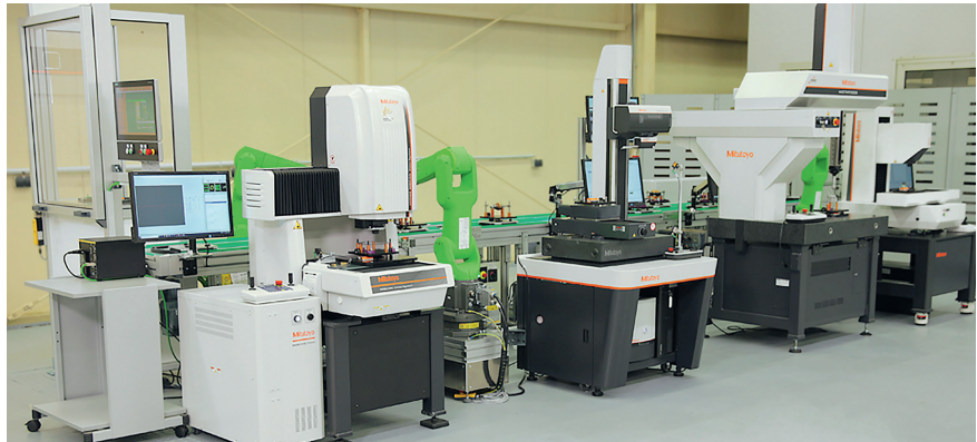
Bild 1. Die Smart Factory Cell, ein Automatisierungskonzept, das Produktionsanlagen jeder Größe intelligenter, effizienter und deutlich benutzerfreundlicher machen soll.

Störungen und teilespezifische Informationen bereichsindividuell abfragbar.