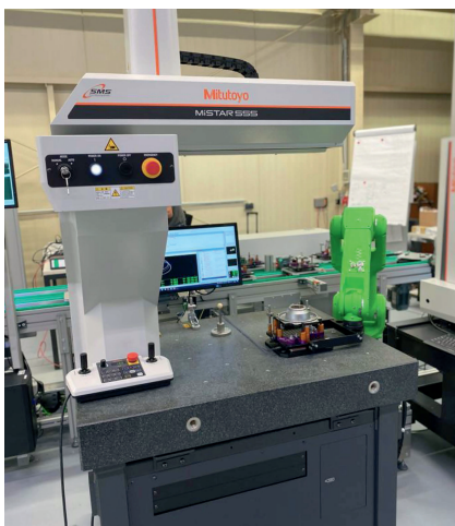
Bild 2. Beladen des KMG MiSTAR555 durch den Roboter FANUC CR14iAL.

Die wahlweise inline, fertigungsnah oder im Messraum platzierte Smart Factory Cell ist in drei Teilbereiche gegliedert: Belade-/Entladestation, Messstation 1 und Messstation 2. Alle drei Bereiche lassen sich unabhängig voneinander über die Benutzeroberfläche steuern. Ebenso sind der Status,